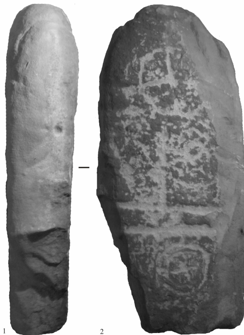
Рис. 4. Лисичанская стела-идол: 1 – левая боковая грань; 2 – тыльная сторона

в районах, непосредственно примыкающих к побережью Черного и Азовского морей, южнее 48-й параллели [Рычков, 1979, с. 16]. Стелы, выявленные севернее этой параллели, весьма специфичны по характеру частей тела, детализировкам изображений, символическим предметам и разнообразным атрибутам. Приведенная ситуация «наталкивает на мысль об исключительности более сложных изваяний по сравнению с более простыми» [Рычков, 1979, с. 19].