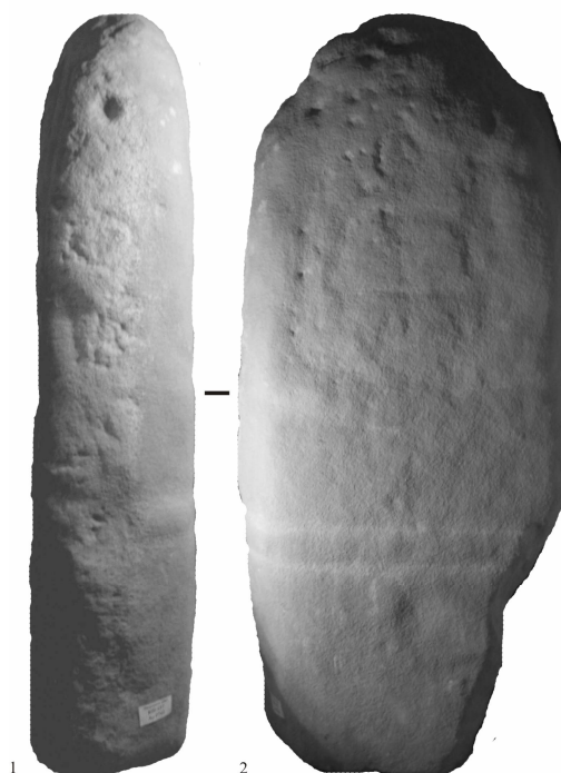
Рис.2. Лисичанская стела-идол: 1 –правая боковая грань; 2 – лицевая сторона

Важен вопрос о месте Лисичанского изваяния в системе сопоставимых памятников эпохи раннего металла Северного Причерноморья. Каменные стелы получили значительную известность из-за неоднократных случаев их нахождения в погребальных комплексах ямной, так называемой кеми-обинской, катакомбной и в меньшей степени срубной [Березанська, Отрощенко, 1997, с. 503] культур. В широком плане были сделаны заключения о зоне ямных, кеми-обинских, усатовских и новосвободненских памятников, объединенных определенными общими признаками материальной культуры, в которой находки каменных стел могут свидетельствовать о близости идеологических представлений [Сафронов, 1974, с. 182], выводы о том, что различные изваяния и стелы маркируют культовую обрядность многих археологических образований, «принадлежат к обширному этнокультурному ареалу» [Даниленко, 1974, с. 83], а сама «идея изображения антропоморфных божеств» характеризует значительные территории Древнего Мира и общества на сходных ступенях исторического развития [Рычков, 1979, с. 19-20].