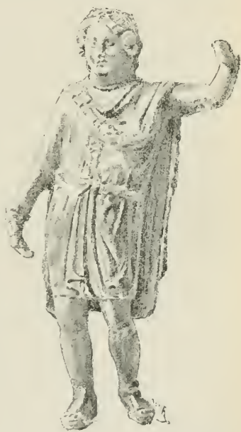
FIG. 1. — Dieu au maillet découvert en Danemark.