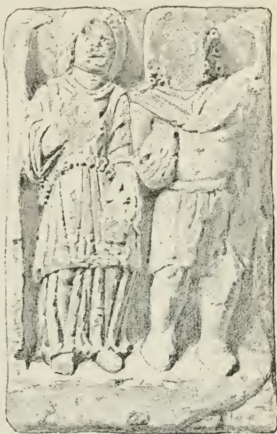
FIG. 2. — Bas-relief du Musée de Besançon.

personnages barbus et des personnages imberbes; les premiers sont tous des vieillards, les seconds des hommes dans la force de l'âge. Même le dieu qui lutte avec un lion, reproduisant le motif classique d'Hercule qui combat le lion de Némée, est imberbe. Il semble donc qu'à une époque antérieure aux textes qui nous restent, les hommes du Nord aient considéré la face imberbe comme un attribut de la force et de l'activité divine. Évidemment, ce ne sont là que des hypothèses; je demande seulement qu'on veuille bien reconnaître